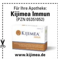
(Abbildung Betroffenen nachempfunden)

Sinkende Temperaturen und weniger Sonne – nun ist die ideale Zeit, etwas für sein Immunsystem zu tun. Ein Schlüsselerorgan dafür ist unser Darm. Dort setzt ein innovatives Nahrungsergänzungsmittel (Kijimea Immun) an. Es enthält drei spezifische Mikrokulturenstämme sowie Vitamin D zur Unterstützung der normalen Funktion des Immunsystems. Das enthaltene Riboflavin trägt zum Schutz der Zellen vor oxidativem Stress und zur Reduktion von Müdigkeit und Abgeschlagenheit bei.